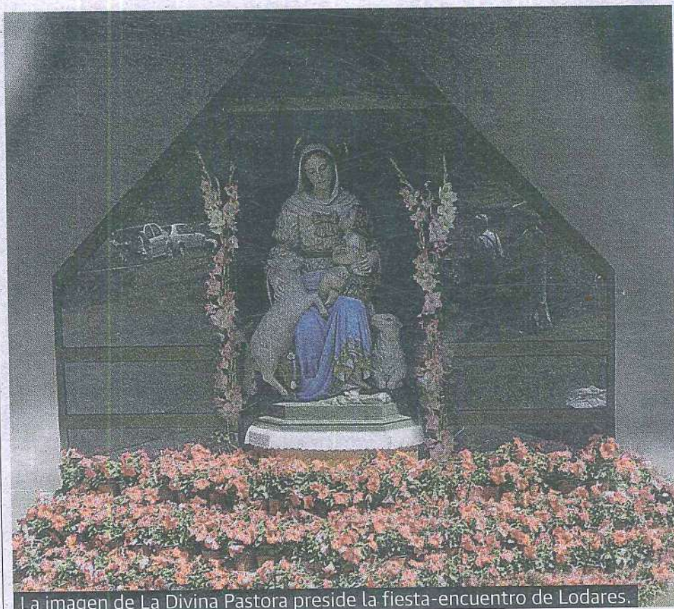
La imagen de La Divina Pastora preside la fiesta-encuentro de Lodaes.

El lugar elegido para la celebración fue la campa del Gamonal, una pradera desforestada al lado de donde estuvo el antiguo pueblo de Lodaes, que en los primeros años presentaba no pocos inconvenientes para albergar actos de este tipo. «Efectivamente, el Gamonal presentaba entonces no pocas carencias para albergar la fiesta, pero muy en especial la falta de sombras para comer y protegerse del sol y también la ausencia de agua. Ambas contribuían al deslucimiento creando no pocos sufrimientos. En 1989 conseguimos permiso de CHD para la plantación de 150 plantas de castaño, sauce y acacia, aun-