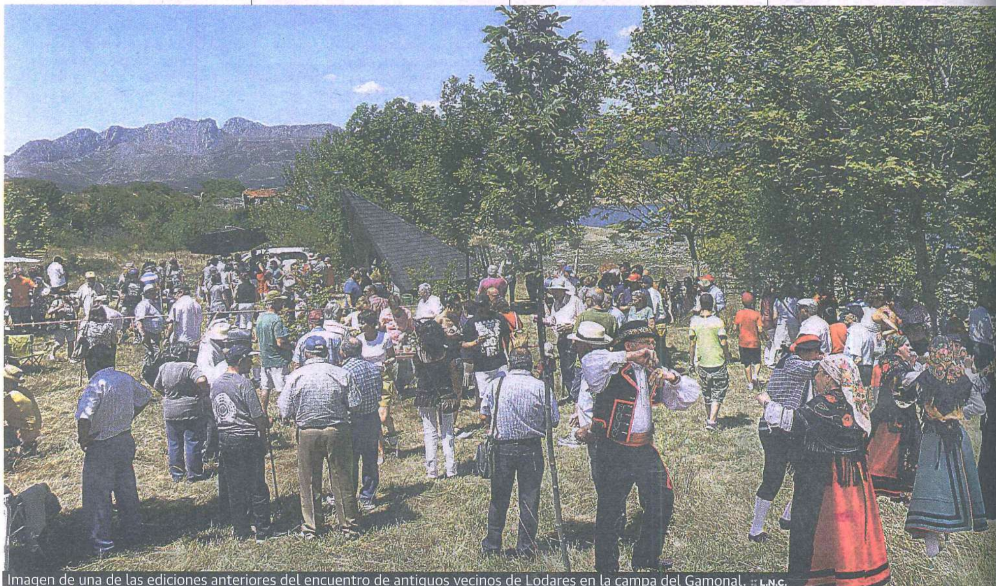
Imagen de una de las ediciones anteriores del encuentro de antiguos vecinos de Lodares en la campa del Gamonal.